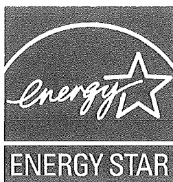
[図2] 国際エネルギースターロゴ